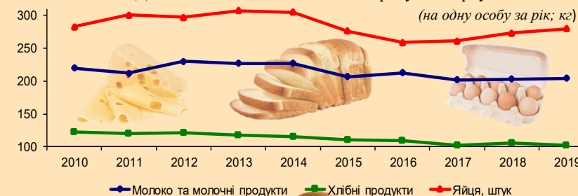
Динаміка споживання основних продуктів харчування

Видання пропонує офіційні статистичні дані, які характеризують соціально-економічний стан сільського господарства області у 2019 році у порівнянні з попередніми роками.