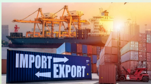
Обсяги імпорту з країн ЄС (млн.дол. США)