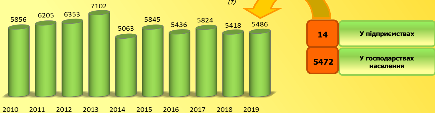
Динаміка виробництва меду в господарствах усіх категорій

На кінець 2019 року на Миколаївщині нараховувалося 165,8 тис. бджолосімей (6,3% від їх наявності в Україні). По кількості бджолосімей область посідає четверте місце серед регіонів держави. Займаються бджільництвом в основному господарства населення, якими утримується 99,6% загальної кількості сімей.