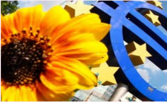
Обсяги експорту до країн ЄС (млн.дол. США)

Підприємства Миколаївщини у 2019 році активно співпрацювали з 27 країнами ЄС. У порівнянні з 2018 роком відбулося уповільнення експортної торгівлі товарами на 22%, послугами – на 1%. Натомість імпорт товарів зріс на 15%, послуг – на 34%.