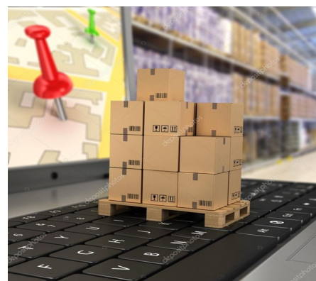
Структура оптового товарообороту у 2019 році

Вміщує інформацію щодо оптового товарообороту за товарними групами, містами та районами, обсягів продажу товарів, які вироблені на території України. Також наведена структура товарних запасів на складах оптових підприємств.